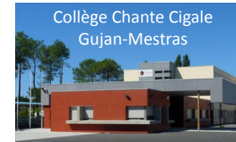
Collège Chante Cigale Gujan-Mestras

Prendre une longueur d'avance pour l'année prochaine (Lycée)