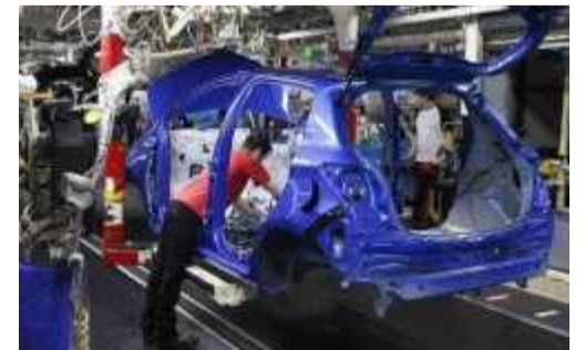
Les métiers répétitifs sont menacés.

L'intelligence artificielle pourrait provoquer une destruction massive d'emplois et « cette fois ce ne sera pas juste une question de cols bleus ou de cols blancs », selon la formule d'Alain Roumilhac, le patron de Manpower France. Les plus pessimistes annoncent une vraie catastrophe avec une humanité quasiment réduite au chômage. Les plus optimistes font le pari que l'IA créera des millions d'emplois et que le solde sera finalement positif. Une chose est sûre : le développement de l'IA va transformer le monde du travail mais personne ne sait vraiment comment. Le Conseil d'orientation pour l'emploi a publié un rapport sur le sujet l'an dernier. Il estime que moins de 10 % des emplois pourraient être menacés de disparition et que 50 % pourraient voir leur contenu « notablement ou profondément » transformé. Les métiers qui reposent sur des « tâches répétitives ou des routi-