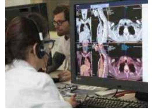
L'imagerie, à la base des mutations.

Pour le moment, ce n'est qu'un projet, mais dans les hôpitaux français, déjà, comme à la Pitié-Salpêtrière (Paris), le cancer est mis à l'épreuve de l'intelligence artificielle. Cet établissement a adopté la solution iBiospy, une plateforme qui révolutionne le traitement de certaines pathologies, comme le cancer du foie, par exemple. En