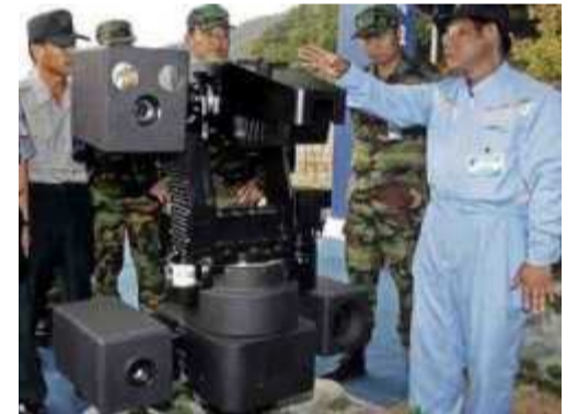
La mitrailleuse autonome de Samsung.