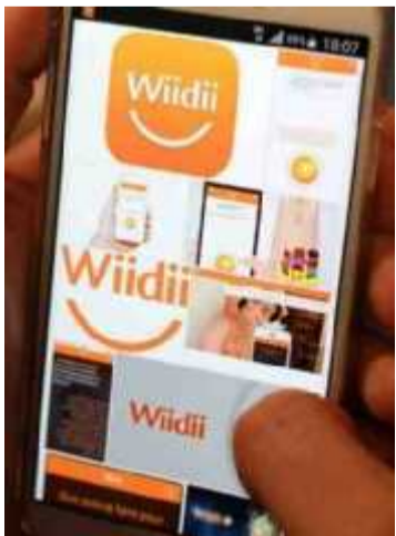
L'application Wiidii propose de nous assister au quotidien.