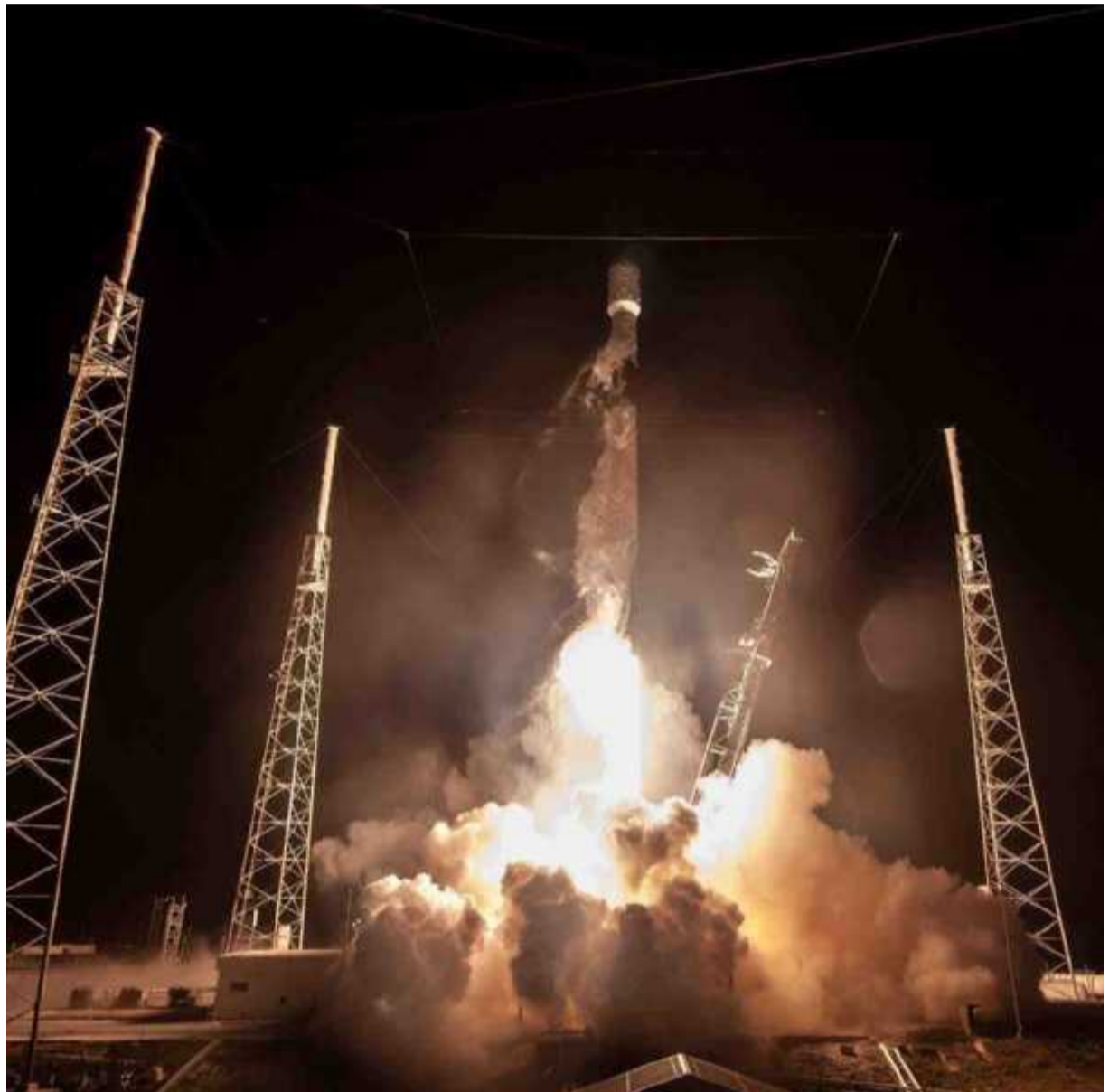
Le 24 mai, la fusée Falcon 9 s'arrache de Cap Canaveral. Sous sa coiffe, 60 satellites. Le même jour, l'image d'un train de satellites SpaceX, passant sur Leiden, aux Pays-Bas. Sa luminosité inquiète les scientifiques comme la profusion des déchets et satellites tournant autour de la Terre.

Ce bouleversement illustre en creux la faiblesse de la régulation des activités spatiales. « Schématiquement, dans bon nombre de pays, vous pouvez aujourd'hui lancer des satellites quand vous voulez, où vous voulez, comme vous voulez », ré-