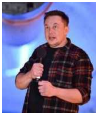
Le milliardaire Elon Musk.