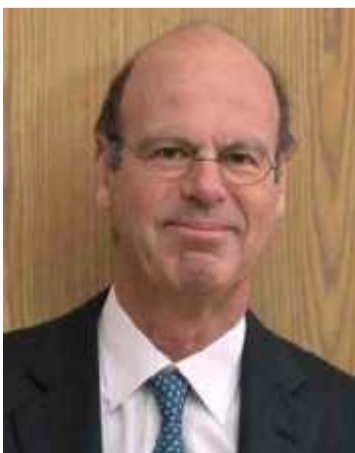
Eric Lombard : « Nous avons engagé 250 millions d'euros depuis le lancement d'Action cœur de ville. »

INVESTISSEMENTS Aujourd'hui et demain, Éric Lombard fait le tour des chantiers soutenus par la Caisse, à Bordeaux et dans les Landes