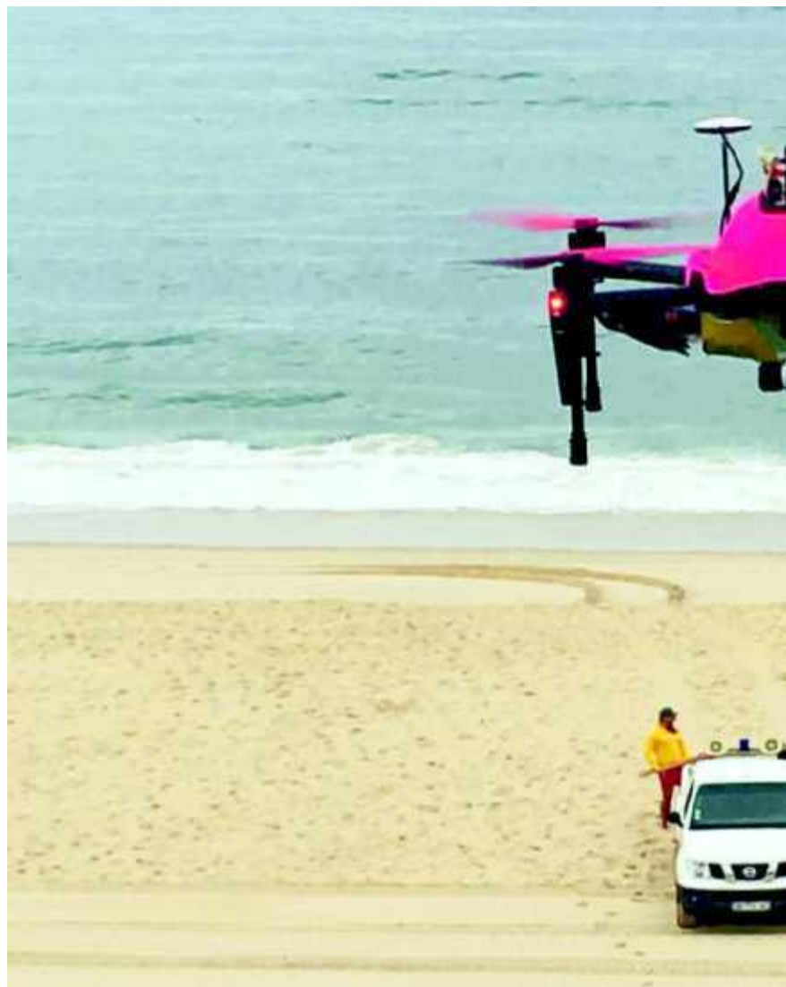
Le Helper sera expérimenté du 20 juillet au 22 août sur la plage Nord de Biscarrosse.