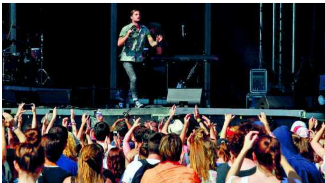
Les Sunset Sons ont inauguré cette vingtième édition de Garorock.

Aujourd'hui, on scrutera avec attention le concert de la jeune artiste française Jain. Son style indissoluble, entre hip-hop, électro et reggae, devrait faire forte impression sur un public assoiffé de rythmes, de soleil et de communion festive. Jean-Christophe Wasner